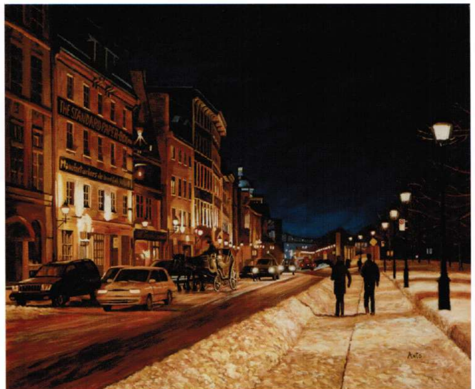
Calèche, rue de la Commune