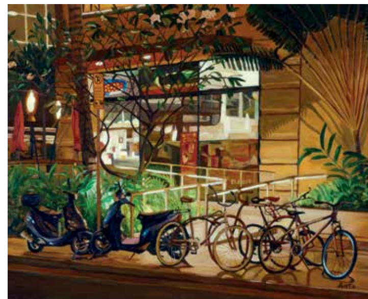
Scoters et Vélos, O'ahu

De retour de Paris, elle prépare actuellement une collection sur la ville des lumières ; nul doute que son adaptation saura parfaire davantage la ville de l'amour.