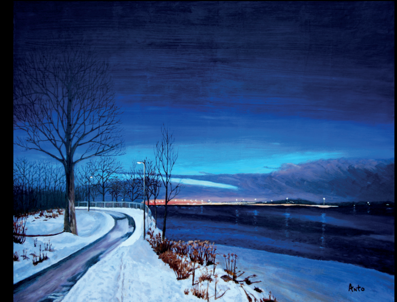
à la tombée du jour