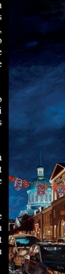
Marché Bonsecours, à Noël

Anto's poetic and tender artworks invite us to immerse ourselves in the picture as though it were a story where we are both spectators and protagonists... an interlude from our everyday lives guaranteed to lift our spirits!