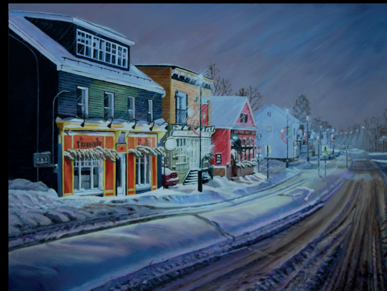
Soir de neige