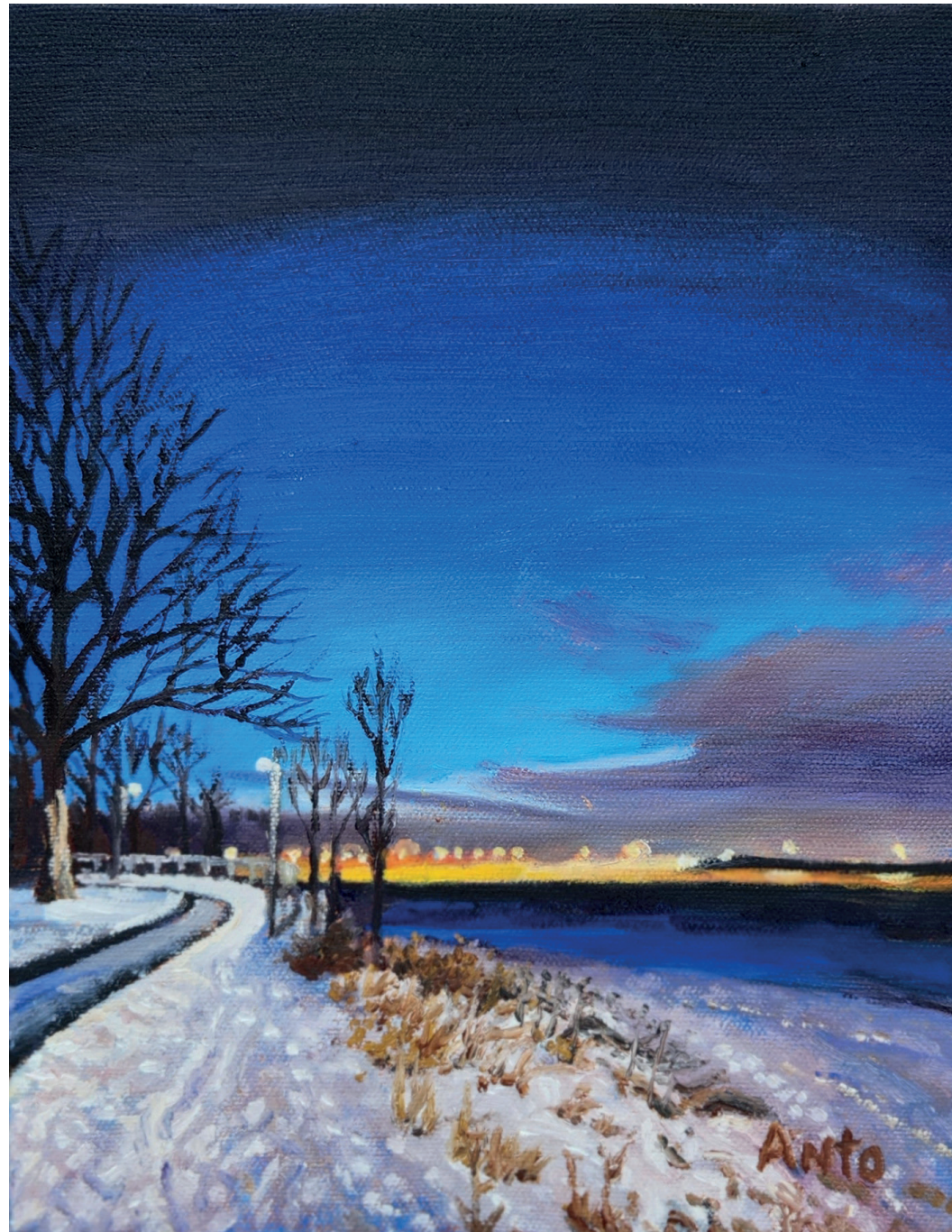
Fin de journée

Heritage Art Gallery 2492 Avenue Royale Beauport Canada.