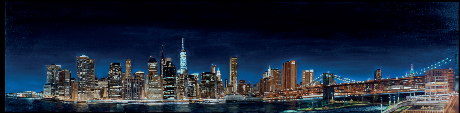
New York, vue de Brooklyn